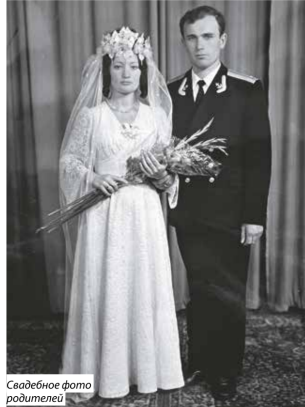
Свадебное фото родителей