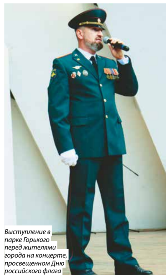
Выступление в парке Горького перед жителями города на концерте, посвященном Дню российского флага