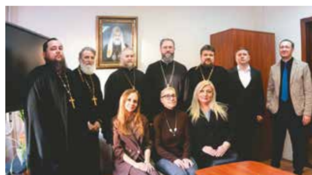
Аспиранты кафедры «Православной культуры и теологии» ДГТУ после сдачи кандидатского экзамена по исторической теологии