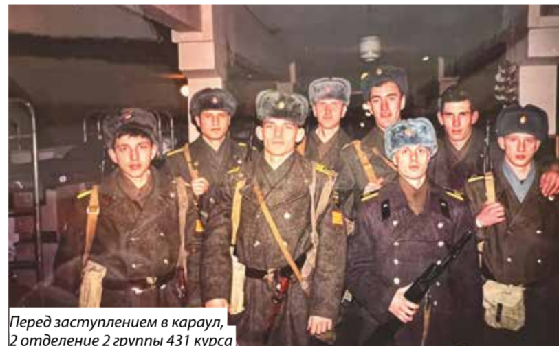
Перед заступлением в караул, 2 отделение 2 группы 431 курса

гического назначения. Я уже заканчивал именно этот вуз (4-й факультет «Автоматизированные системы управления»).