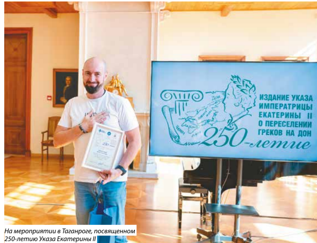
На мероприятии в Таганроге, посвященном 250-летию Указа Екатерины II

В день у нас бывает по три-четыре концерта в разных точках. Выезжаем