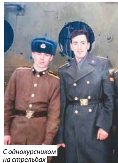
С однокурсником на стрельбах

– За годы службы я побывал во многих местах, даже на Дальнем Востоке, видел Татарский залив, Сахалин. В 1999 году, по окончании училища,