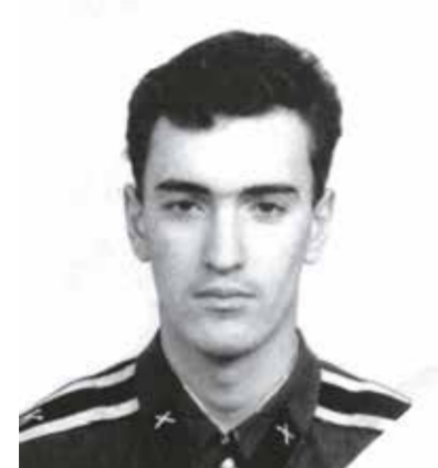
Курсант 421 курса РВВКИУ РВСН им. главного маршала артиллерии М.И. Неделина

сообщили о переводе училища в Иркутск. Я, парень из Крыма, посмотрел на карте, где находится Иркутск, и в свои 16 лет понял, что это далеко! Вдвоем с другом мы сели, подумали и решили: нужно ехать в Краснодар или Ростов, поскольку в обоих городах были военные училища. Окончательный выбор пал на Ростов: он совсем недалеко от Мариуполя, где прошло все мое детство. В Мариуполе я проводил школьные каникулы, там жили мои бабушки и многочисленные родственники.