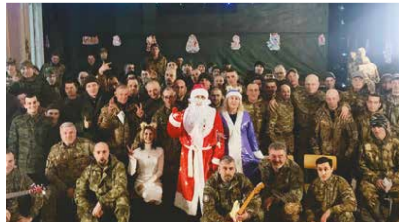
После выступления Фронтальной творческой бригады «Голоса фронта. 61 регион» перед бойцами одного из подразделений на Донцеком направлении (СВО)

– А какой род войск Вы выбрали? – Там, где я рос, была авиация, поэтому сначала я поехал в Ейск, в летную школу. Но, к сожалению, нам